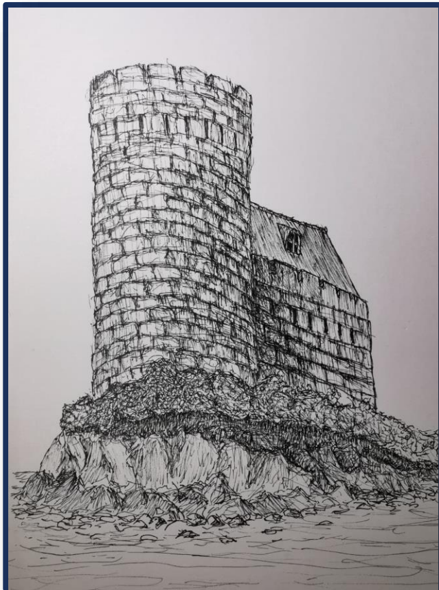
Eräs tekemäni tussipiirustus vuodelta 2020.

Kun ensimmäisen kerran ajattelin tekeväni kuvataidekoulun lopputyön, keväällä 2020, ensimmäisenä mieleeni tuli tussipiirustus.