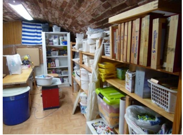
Keramiikan ja tekstiilin varastotila