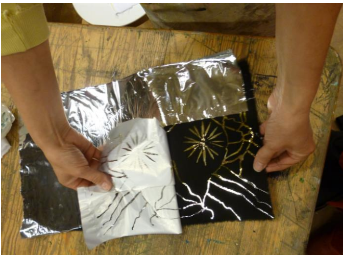
Folion poistaminen jäähtyneeltä kankaalta.