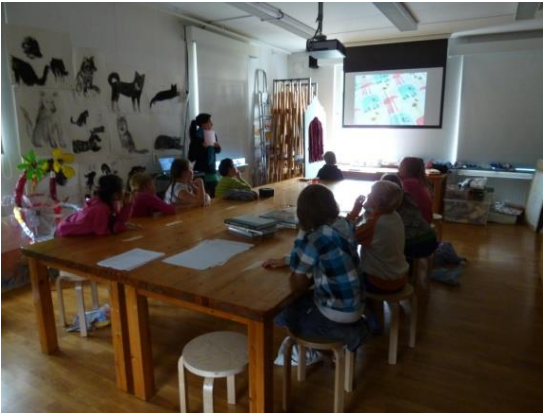
Luokkahuone Strömsin kartanossa, jossa tekstiilitaidetta opetetaan