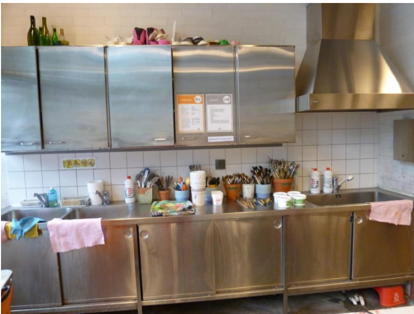
Espoon kuvataidekoulun tekstiililuokka