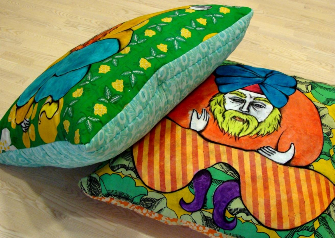
Päättötyö vuodelta 2011 Emmi Kairenius; kierrätysmateriaalit ja kankaanmaalaus

useampi pitkän linjan kuvislainen haluaa hakeutua taiteen / tekstiilin alan jatko-opintoihin. Meidän tulee voida antaa vankka tiedollinen ja taidollinen sekä omaa taiteellisuutta tukeva perusta, jolta ponnistaa eteenpäin.