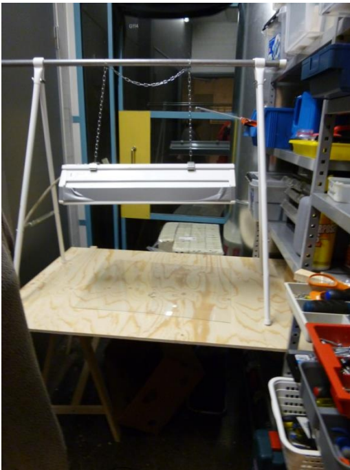
Espoon kuvataidekoulun valotuspaikka

Helmiäisvärien käyttö oli kaikille tuttua samoin kankaanmaalaus. Turbo- eli kohopaino oli myös kokeiltu ja todettu esimerkiksi t-paidan (trikoo) painamisessa käyttökelpoiseksi tekniikaksi. Kokeilimme myös Emotuotannon uusia peittäviä painoemulsioita, jotka eivät muodostaneet muovimaista pintaa kankaalle.