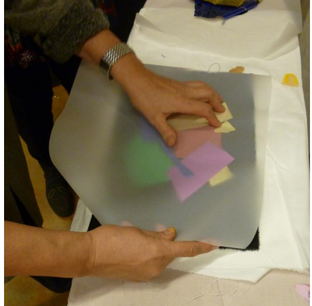
Liiman levitys, folioiden asettelu ja silittäminen leivinpaperin päältä.